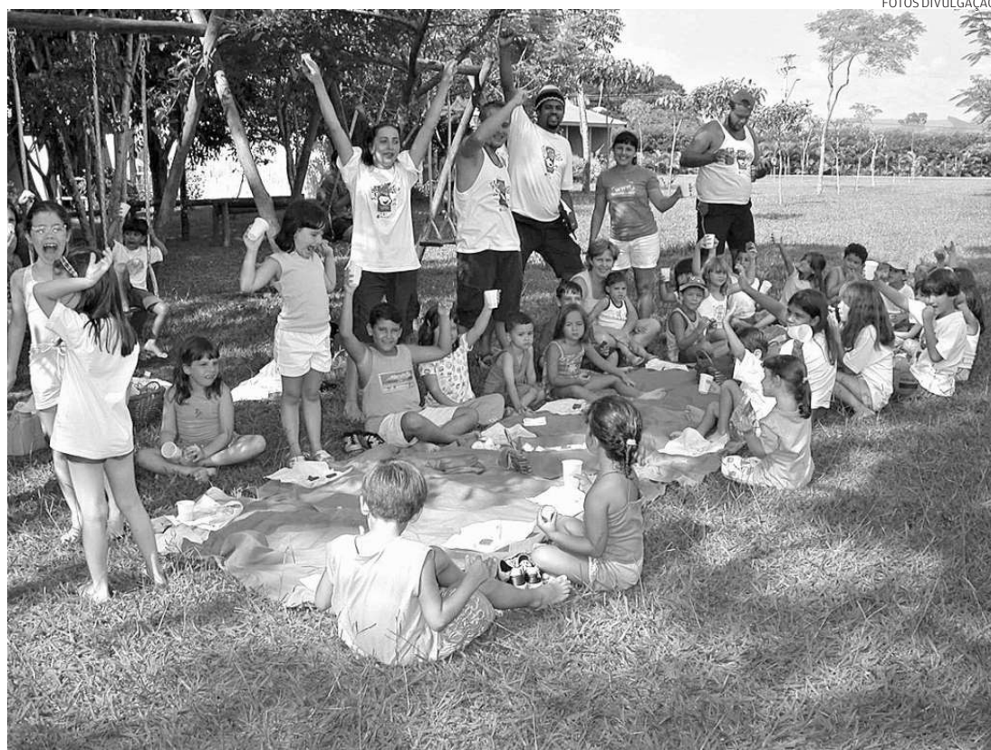
No Mazzaropi, eleito o melhor do Brasil no gênero, a garotada se diverte durante piquenique no jardim