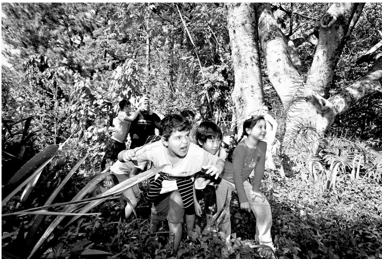
O contato com a natureza e a valorização do meio ambiente estão na ordem de cada dia da semana na charmosa Fazenda Capoava, em Itu

Para que as férias de julho sejam divertidas e inesquecíveis, o Hotel Fazenda São João preparou, para toda a família, en-